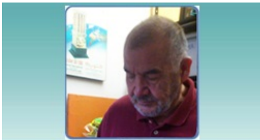
MENTORES DE FASOL A.C.

Es un elemento que no forma parte del staff, sino que pertenece a una red de voluntarios activistas y profesionales que trabajan en los temas prioritarios para FASOL en sus propias localidades/estados. Se encargan de identificar, reunir y atender a grupos que trabajan en proyectos socio-ambientales correspondientes con la agenda FASOL donde se incluyen temas como aseguramiento del acceso al agua potable y eco sistémica, alternativas productivas sustentables, actividades de desarrollo económico, fortalecimiento de capacidades para adaptarse al cambio climático, defensa del valor cultural único de los pueblos originarios, defensa y soberanía alimentaria, así como la defensa del Territorio, defensa de Derechos Humanos, entre otros. En el proceso de otorgamiento, los mentores remiten las propuestas de proyectos a la Coordinación de Operaciones en las diferentes rondas y acompañan a los grupos en la elaboración de sus propuestas y la firma del convenio, manteniendo contacto continuo con la Dirección Ejecutiva y la Coordinación de Operaciones. Después de acompañar al grupo durante la ejecución del proyecto aprobado, se aseguran de que el grupo de base apoyado remita su informe final a FASOL conforme a los requerimientos establecidos en el convenio de otorgamiento.